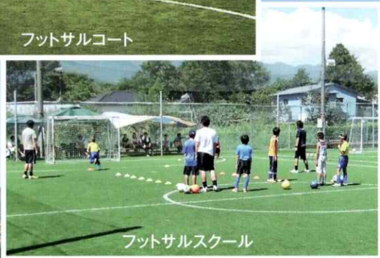
フットサルスクール