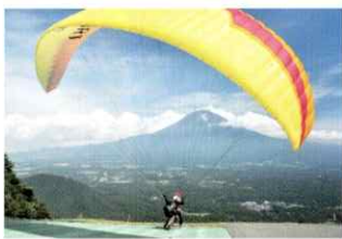
パラグライダー場