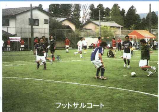
フットサルコート