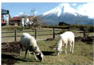
富士ミルクランド