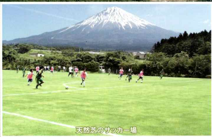
天然芝のサッカー場